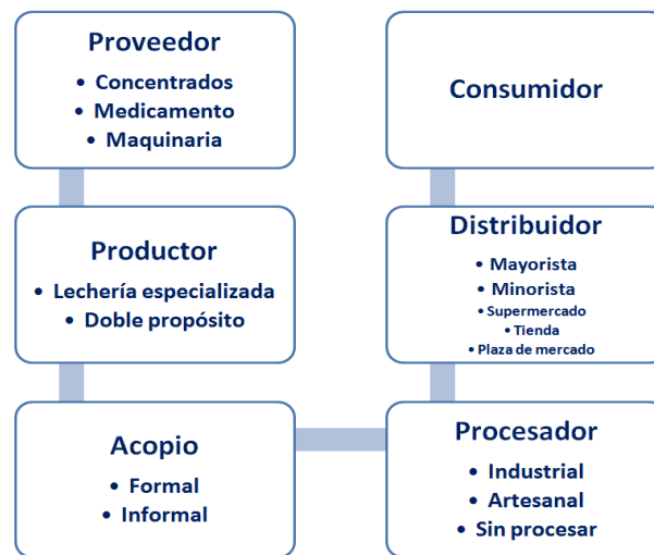
Figura 2: Cadena productiva del sector lácteo en Colombia

El primer eslabón de la cadena son tiendas que suministran los insumos para la finca y para el ganado. El segundo eslabón son los productores que pueden ser hatos especializados en producción de leche o explotaciones ganaderas. Este último se conoce como doble propósito. Generalmente los hatos se encuentran a más de 2000 metros de altura y los negocios de ganadería a menos de esta altitud. Por esta razón, los primeros se denominan de trópico alto y los segundos, de trópico bajo. En los hatos de trópico alto el negocio de la leche equivale al 50% del sistema productivo, en los de trópico bajo apenas al 20% porque allí prevalece el quehacer del ganado y el negocio de la carne.