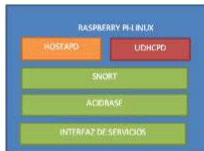
Figura. 1. Diagrama de componentes, Elaboración Propia

En la fase de implementación se documentaron los parámetros de la codificación, por medio de un diagrama de componentes, como en las Fig.1 y Fig. 2 en el cual se ilustran y describen detalladamente las aplicaciones utilizadas tanto para el desarrollo de escritorio como para el desarrollo móvil, así mismo se asesora con sencillos manuales su instalación.