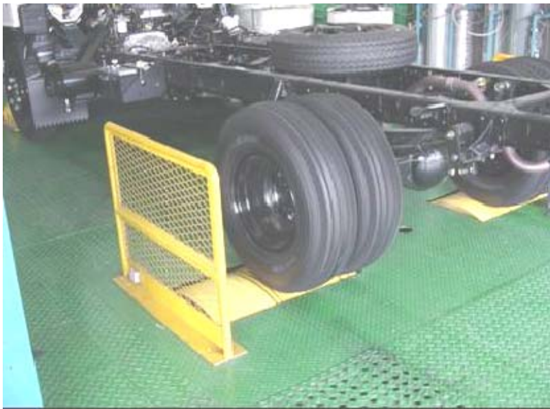
Figura 3: Chasis dinamométrico

El chasis dinamométrico está equipado con un modo de velocidad constante, lo que permite operar a una condición de operación constante, ya sea con o sin un vehículo colocado sobre los rodillos. El banco mantiene la velocidad con precisión en todo el rango de capacidad del torque. El modo de operación de velocidad constante es útil para realizar pruebas de rendimiento de los vehículos a diferentes velocidades y condiciones de carga. Las mediciones de fricción en el motor y el tren pueden ser simuladas en varias velocidades.