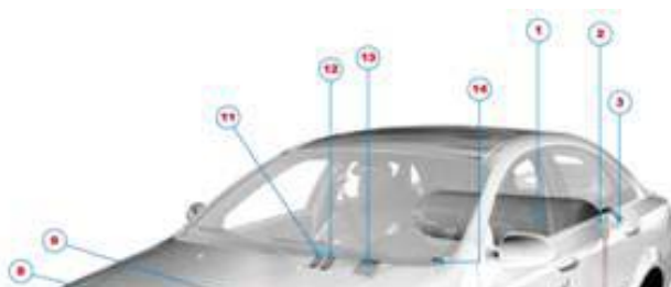
1. Cilindros de almacenamiento

El GNV contenido a presión en el tanque (3000 psi) llega a un regulador mediante canalizaciones rígidas de dos o tres etapas con diafragmas. En el regulador la presión del tanque desciende hasta la presión de salida. Posteriormente, ocurre la mezcla del gas con el aire en un mezclador, similar al de los motores carburados, mediante la aspiración de gas por el múltiple de admisión, desconectándose los inyectores cuando el vehículo opera a GNV. En este sistema se emula la sonda de gases engañando a la computadora original del vehículo mediante la modificación del programa o la inserción de emuladores.