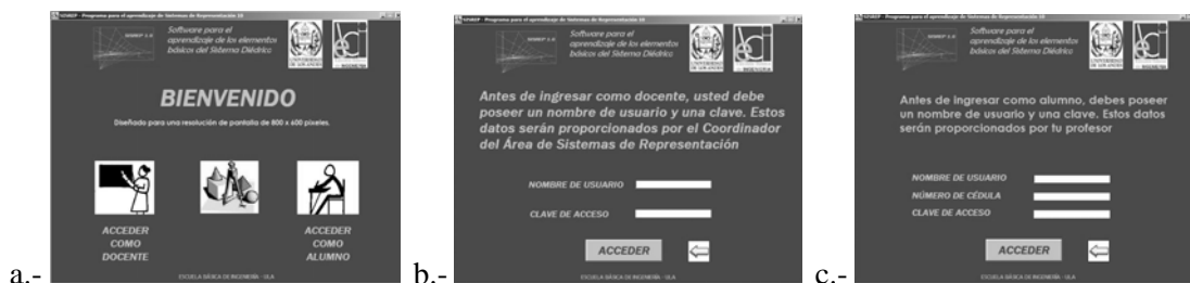
Figura 3: Pantalla Inicial (a), Ingreso a Módulo del Docente (b) e Ingreso a Módulo del Alumno (c)

La aplicación desarrollada consta de dos módulos principales: Módulo del Docente y Módulo del Alumno. A cada uno de ellos se accede una vez seleccionada la opción correspondiente en la Pantalla Inicial. El ingreso a cada módulo se realiza previa validación de los datos requeridos por el sistema: Nombre de Usuario y Clave de Acceso, para el caso del docente y Nombre de Usuario, Cédula de Identidad y Clave de Acceso, en el caso del estudiante (ver Fig. 3).