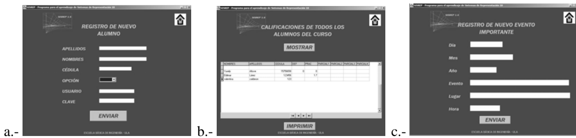
Figura 4: Registro de Nuevo Alumno (a), Ver Calificaciones (b) Registro de Nuevo Evento (c)