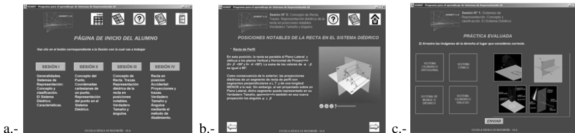
Figura 5: Página de Inicio del Alumno (a), Pantalla de contenido (b) Pantalla de práctica evaluada (c)

Luego de la última pantalla de contenido de cada tema, el sistema propone al usuario alumno una serie de ejercicios en lo que se denomina “Práctica Guiada”. El software ofrece pistas y retroalimentación formativa de acuerdo con las respuestas provistas por el alumno, el cual tiene la posibilidad de realizar los ejercicios tantas veces como crea necesario. En la última pantalla de la Práctica Guiada aparece un botón que permite acceder a la sección de “Práctica Evaluada”, en la que el estudiante deberá realizar una serie de ejercicios sin contar con pistas ni retroalimentación. También se omiten los botones de acceso a la Ayuda y al Glosario (Fig. 5-c). Las calificaciones obtenidas por el alumno en la Práctica Evaluada son procesadas y almacenadas en la base de datos correspondiente.