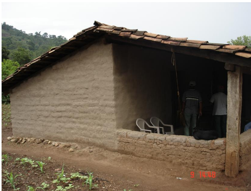
Figura 7: Aplicación de revestimiento en una vivienda del Municipio de Quezada en Guatemala