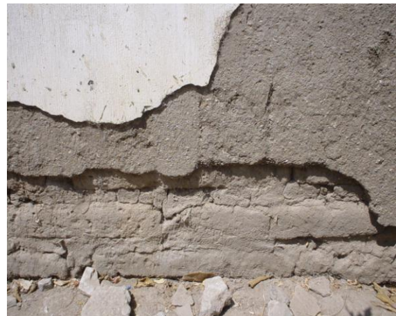
Figura 2: desprendimiento de capas de revestimiento en muros de tierra (adobe)

Aunque los revestimientos son importantes para preservar las edificaciones, es de igual o mayor importancia la influencia que ellos tienen en la prevención de la transmisión de enfermedades. Dentro de las construcciones de adobe se han encontrado chinches que transmiten la enfermedad de Chagas. El Triatoma dimidiata , es el principal vector de esta enfermedad en Guatemala, que tiene amenazados a millones de guatemaltecos y contagiados a varias decenas de miles.