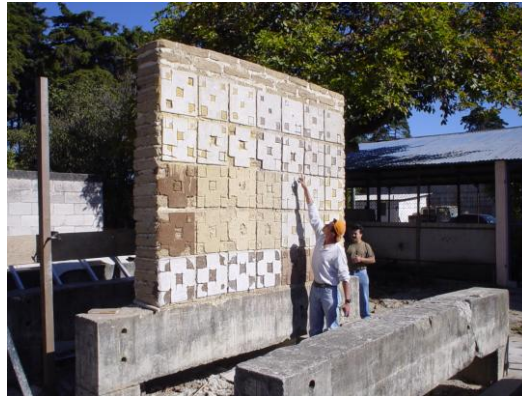
Figura 3: muro de tierra (adobe) con muestras de revestimiento

Para el ensayo de adherencia por arrancamiento fue necesario construir un muro de adobe a escala natural, sobre el cual se elaboraron muestras cuadradas de revestimiento seleccionadas de cincuenta centímetros por lado (Ver Figura 3). Las muestras se dejaron endureciendo por un período de 30 días.