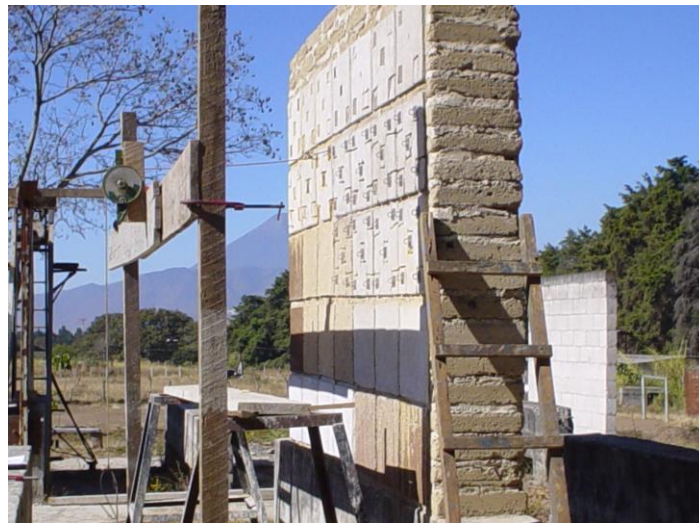
Figura 5: Muro de tierra (adobe), durante el ensayo de un revestimiento

Al concluir los ensayos mecánicos de adherencia se realizó la evaluación cualitativa de cada revestimiento (apariencia visual, erosión y fisuración). La Tabla II indica los valores obtenidos en los ensayos de tracción por arrancamiento y los resultados de la evaluación cualitativa, así como la calificación final del revestimiento evaluado.