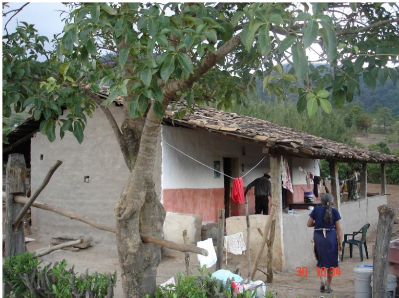
Figura 6: Aplicación de revestimiento y color en una vivienda de la zona oriental de Guatemala