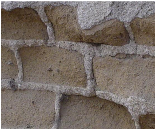
Figura 1: Erosión en muros de tierra (adobe)

Las paredes de adobe o construcciones de tierra se ven frecuentemente afectadas por radiaciones solares, cambios de temperatura, lluvias, humedades y el ataque de insectos. Todos estos agentes en conjunto provocan una degradación y erosión continua y constante del material, lo que hace disminuir a estas edificaciones su capacidad sismorresistente y colapsar muy fácilmente ante un movimiento de esta naturaleza (Ver Figuras 1 y 2). Muchas veces el deterioro alcanzado llega a ser tan severo que las edificaciones colapsan por sí solas. Por ésta razón, para disminuir ese riesgo, es aconsejable adicionar a las paredes una protección.